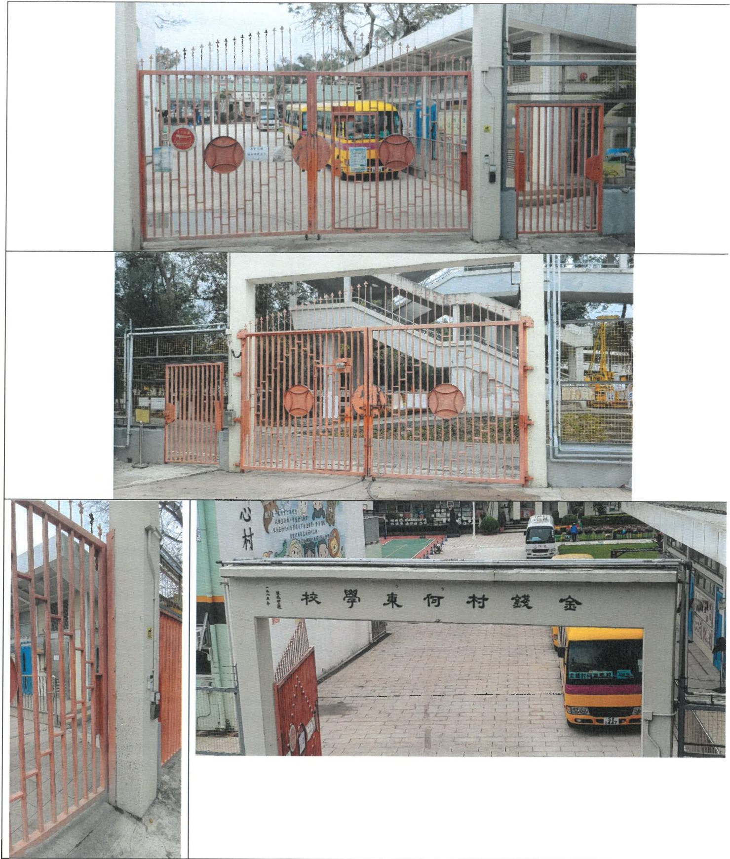
施工位置參考圖片：